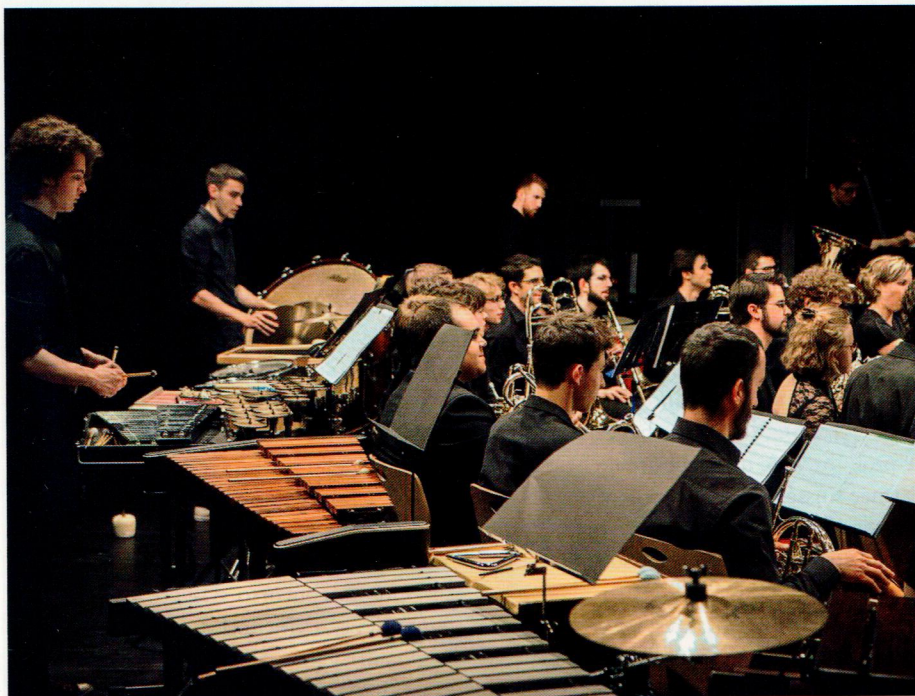
Cette année, la Micro-Harmonie revisitera la Passion du Christ.

La Micro-Harmonie, ensemble de catégorie Excellence qui fonctionne par projets, propose cette année une œuvre inédite, la Passion du Christ vue par les femmes. Avec sur scène 55 musicien(ne)s, 100 chanteuses et 2 cantatrices.